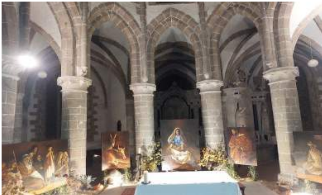
Crèche à L'Abbatiale