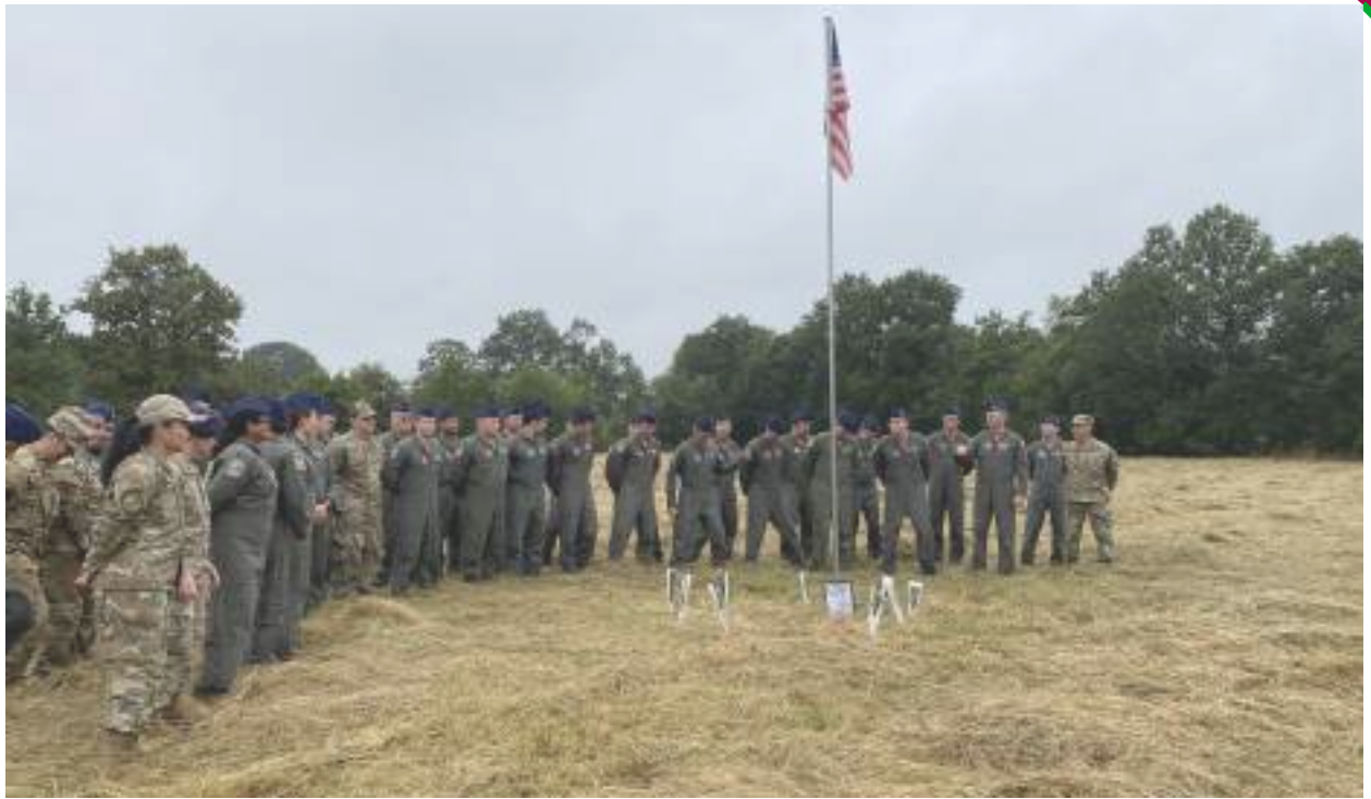
80 ans après, le 9 août 2024, sur le lieu du crash