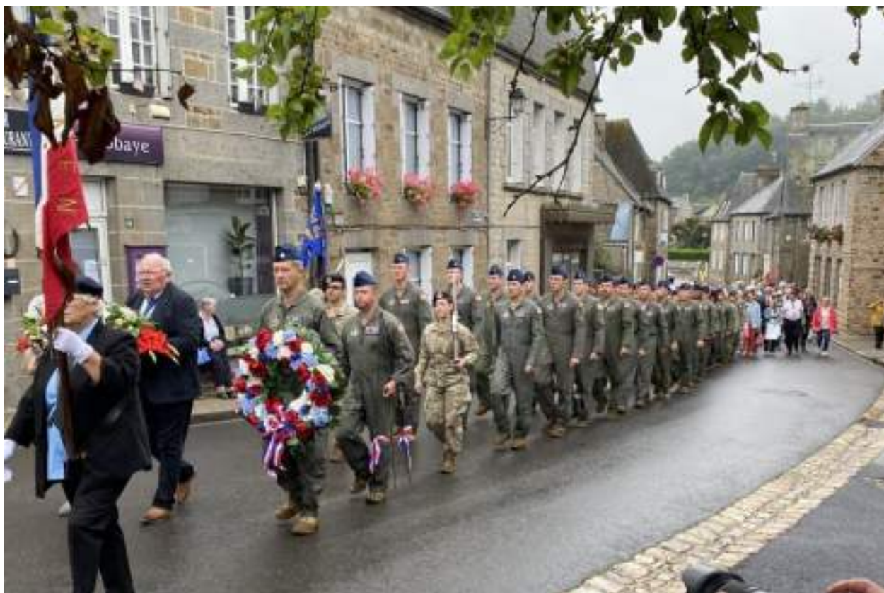
L'arrivée du cortège au monument aux morts de Lonlay-l'Abbaye (Orne) le 9 août 2024.

Vendredi 9 août 2024, une délégation d'une cinquantaine de militaires américains et quelques civils ont participé à la commémoration de la Libération de la commune.