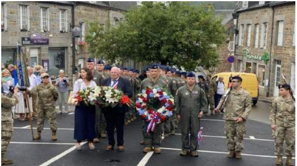
Représentation franco-américaine devant le monument aux morts de Lonlay-l'Abbaye le 9 août 2024.

puis au monument aux morts, se sont retrouvés, les représentants de ces mêmes nations. Après 80 ans, ce ne sont plus, bien évidemment, les témoins de l'époque, mais la présence des nouvelles générations rendant hommage à leurs compatriotes disparus est réconfortant. Ils sont tombés pour la liberté, mais pas dans l'oubli !