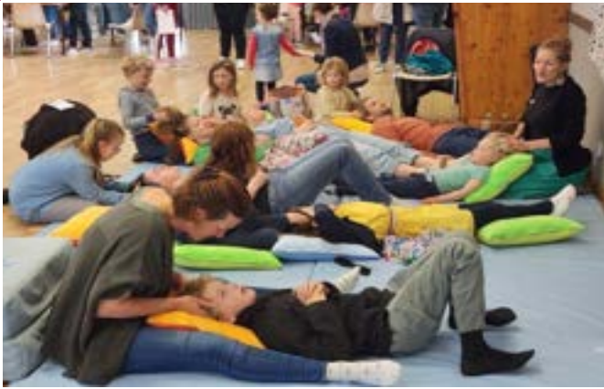
Un atelier massage pour petits et grands à la salle des fêtes de Lonlay-l'Abbaye