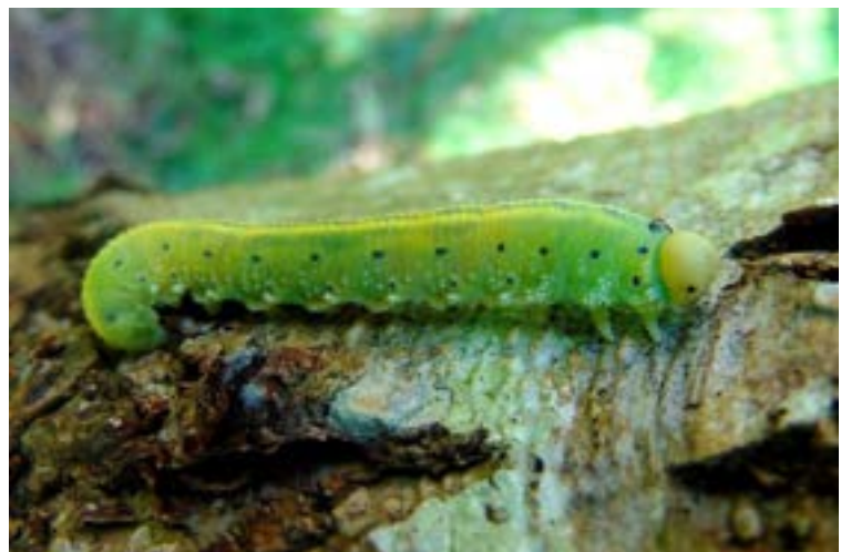
[Illustration :Larve de Cimbex connatus , première mention sur le territoire du Parc & Géoparc]

Les candidatures pour la seconde édition sont d'ores et déjà ouvertes (rendez-vous sur le site web du Parc et du Géoparc pour postuler !), elle devrait débuter officiellement à la fin septembre 2024. À noter que cette mission citoyenne permet d'améliorer la connaissance naturaliste sur le territoire, à l'heure où de nombreuses espèces sont en régression en France et dans le monde.