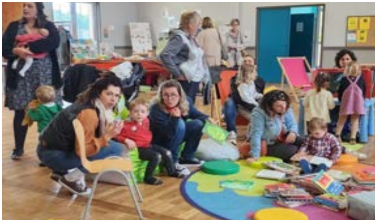
Des familles venues passer un bon moment.

Les familles ont répondu présentes puisque pratiquement tous les ateliers ont affiché complet.