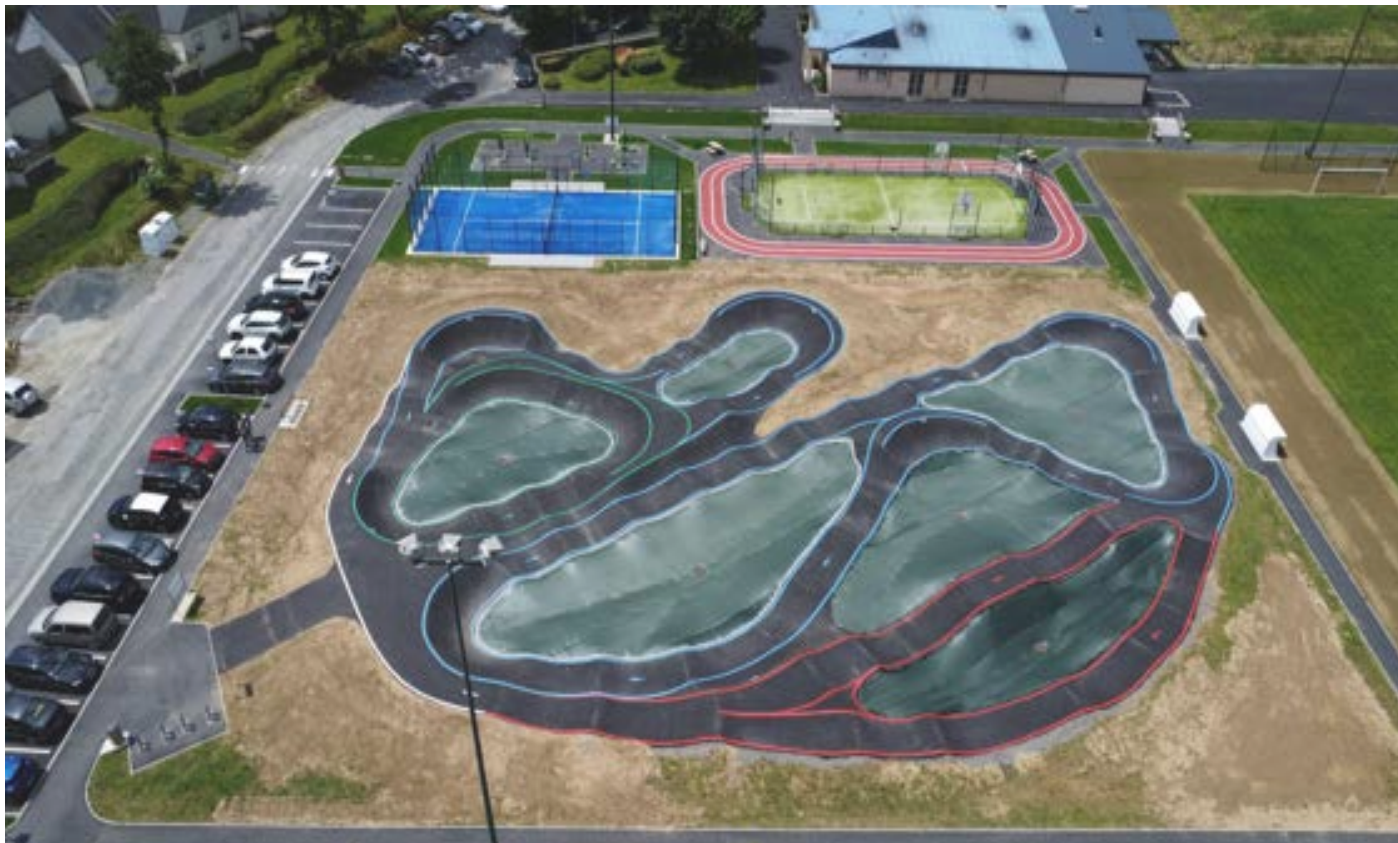
Mars 2024. L'ensemble sportif et de loisirs intergénérationnel de Lonlay-l'Abbaye (Orne) vu du ciel par un drone.

Il permettra de faire du sport et de bouger tous ensemble, à tout âge.