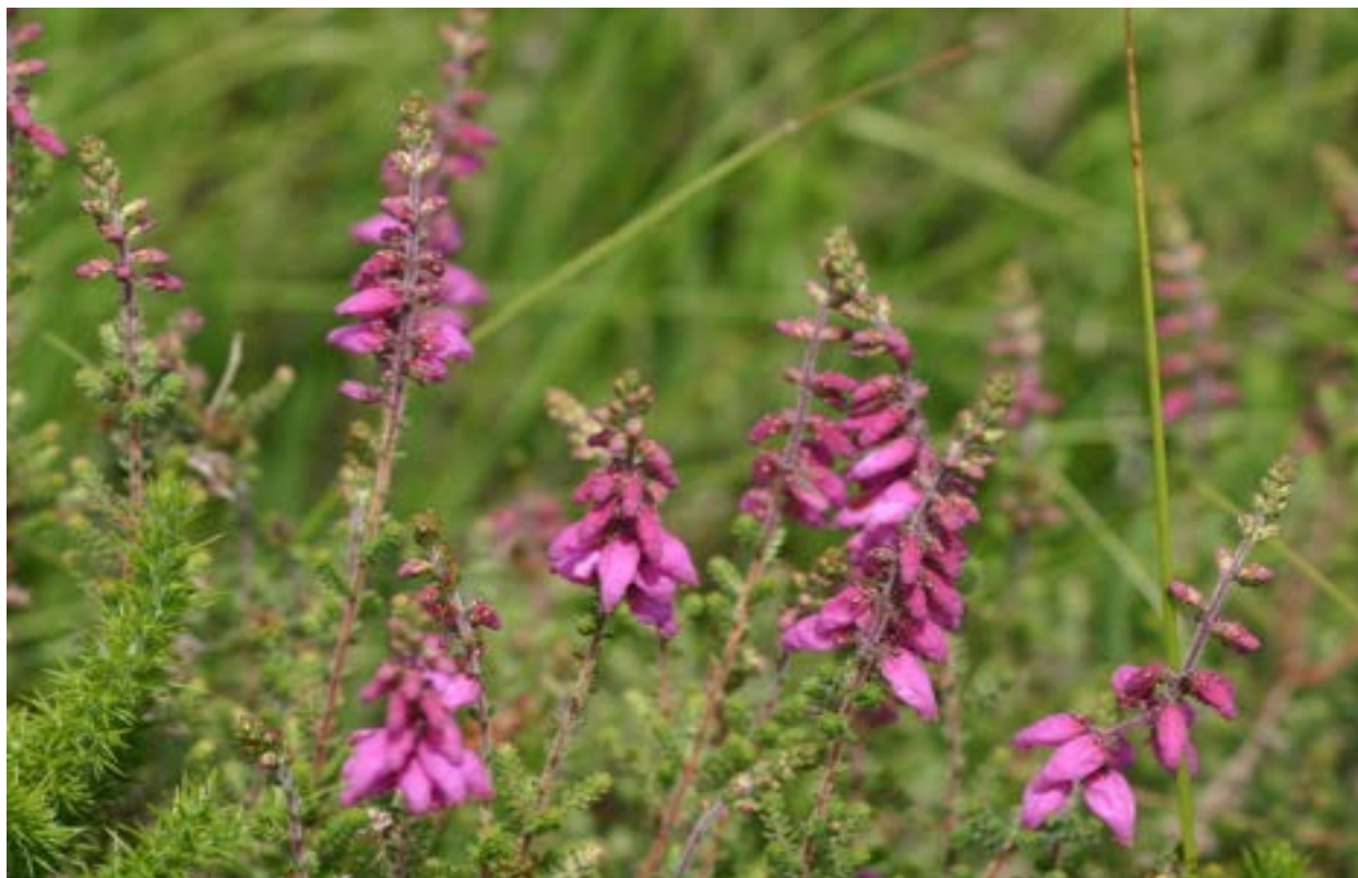
[Illustration : Lande du tertre Bizet ]