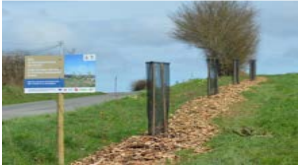
[Illustration : Plantation de haies]

Pour plus d'informations sur le site web du Parc et du Géoparc, dans la rubrique bocage.