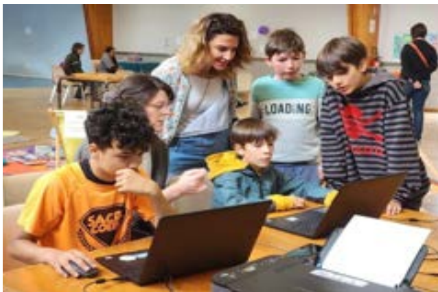
Atelier fabrication de badges pour les ados.

La journée des familles organisée samedi 1er juin 2024, a attiré de nombreux enfants et adolescents dans la salle des fêtes de Lonlay-l'Abbaye (Orne).