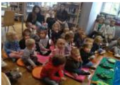
Le Bateau de Monsieur Zouglouglou

Les enfants de chaque classe ont pu découvrir trois Tapis de Lecture :