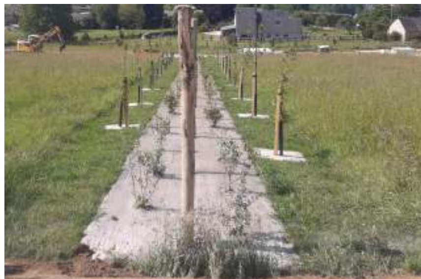
Plantation d'une nouvelle haie au centre de l'aménagement