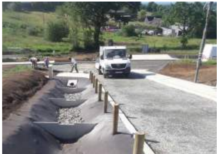
Noues de collecte des eaux de ruissellement