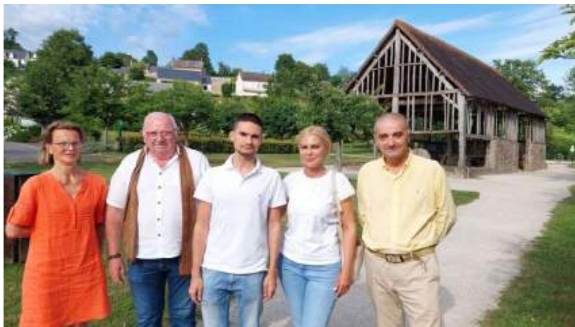
Les élus de Lonlay-l'Abbaye (Orne) ont accueilli un jeune dentiste roumain (au centre) avec ses parents. © Par Nathalie GUÉRIN / Publié le 29 Juin 23 à 19:06

Un jeune dentiste roumain a visité Lonlay-l'Abbaye (Orne) du 19 au 21 juin 2023. Il est reparti en donnant son "accord verbal" au maire pour ouvrir un cabinet dans la commune.