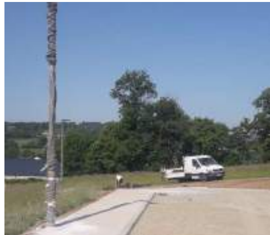
Équipement éclairage et voie d'accès