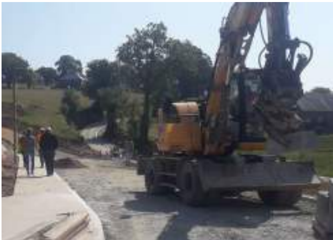
Réunion de chantier