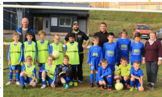
Les U11 A rencontre les U 11 B le 13 octobre 2018

L'équipe B a participé au Challenge Michel Portier et a été éliminée.