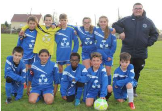
U 13 à St Bômer contre Vallée Udon FC1 le 10 novembre 2018