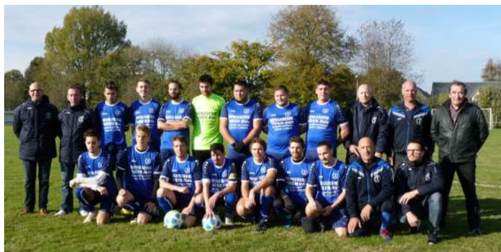
Séniors A - Remise de maillots par la Menuiserie GUERIN de St Bômer