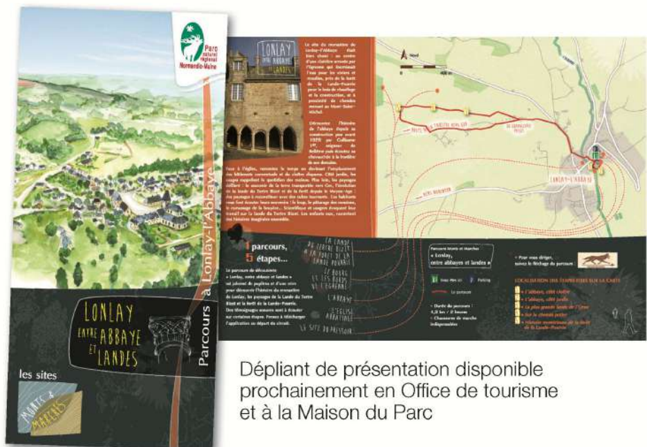
Dépliant de présentation disponible prochainement en Office de tourisme et à la Maison du Parc