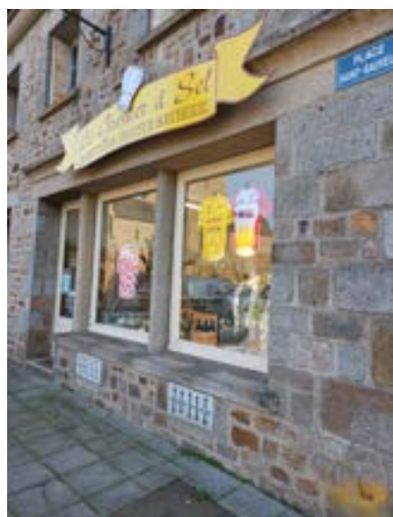
VITRINES DE NOS COMMERÇANTS