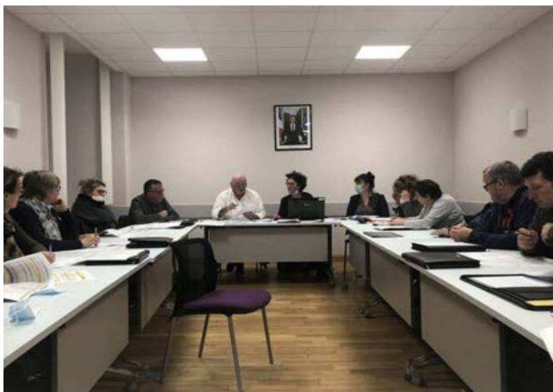
Le conseil municipal de Lonlay-l'Abbaye, dans l'Orne, mercredi 2 mars 2022

Lors du conseil municipal de Lonlay-l'Abbaye, dans l'Orne, les élus ont voté en faveur d'une enveloppe de 20 000 € destinée à payer les services d'un cabinet de recrutement. L'objectif : faire venir un nouveau médecin dans la commune.