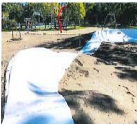
Un pump park (photo d'illustration).

Dans ces conditions, la municipalité propose de présenter un