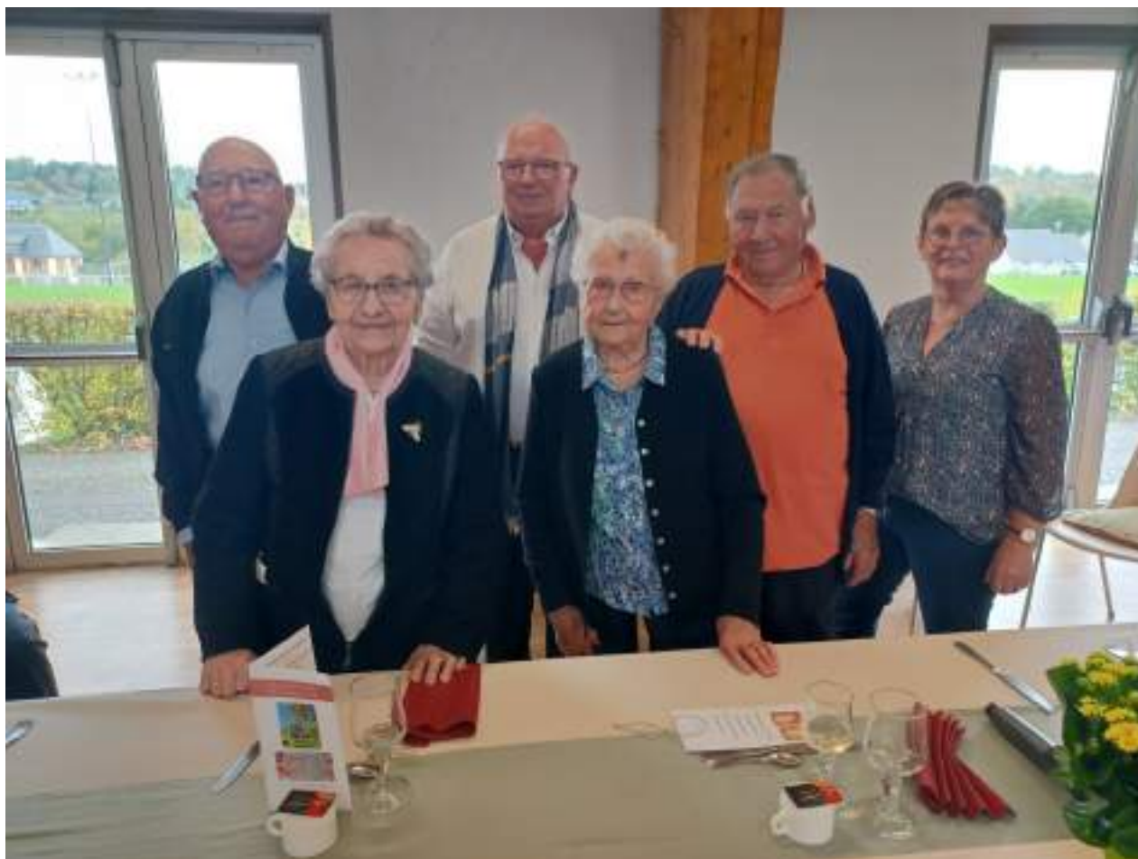
Les doyens avec le maire de Lonlay

Le repas des aînés offert par la commune a eu lieu le mercredi 26 octobre 2022