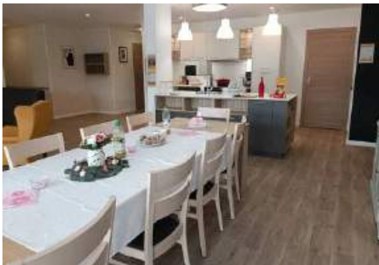
Vue d'une partie de la salle à manger et de la cuisine.

La livraison des maisons Ages et Vie le 12 octobre 2022, a donné lieu en même temps à une porte ouverte pour la population et les élus avant l'ouverture officielle le 10 novembre.