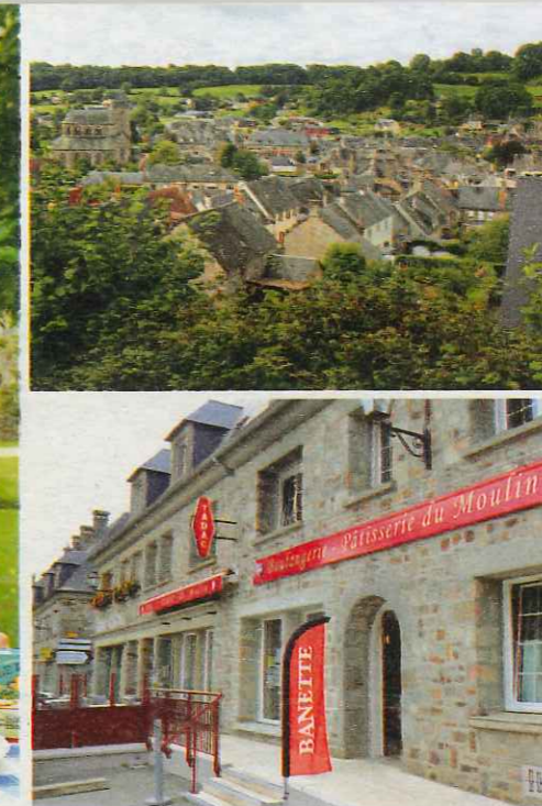
Le temps d'un pique-nique normand autour de bons produits du terroir et d'une baguette encore tiède achetée à la nouvelle boulangerie.